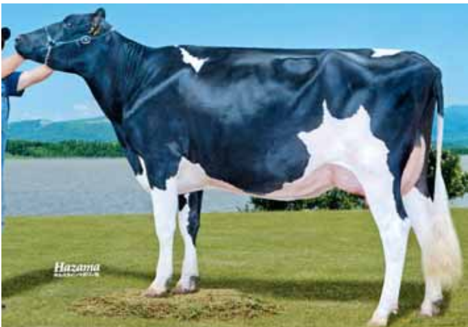
娘 ミックラン ロードビュー ビュー 北海道広尾町 (有)ミックランデーリイ 所有 母の父:エンドレス ジアンピ