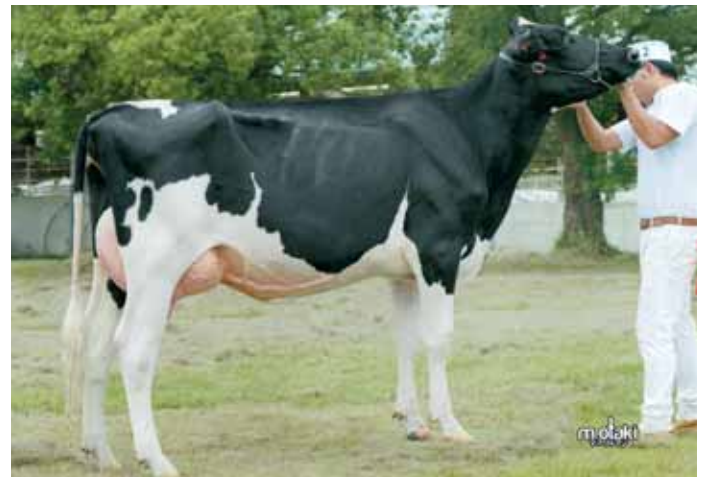
娘 KM ゴールドミツシー コウケン 熊本県錦町 (株)有田牧場 所有 母の父:ミスター チャシティー ゴールド チツプ ET