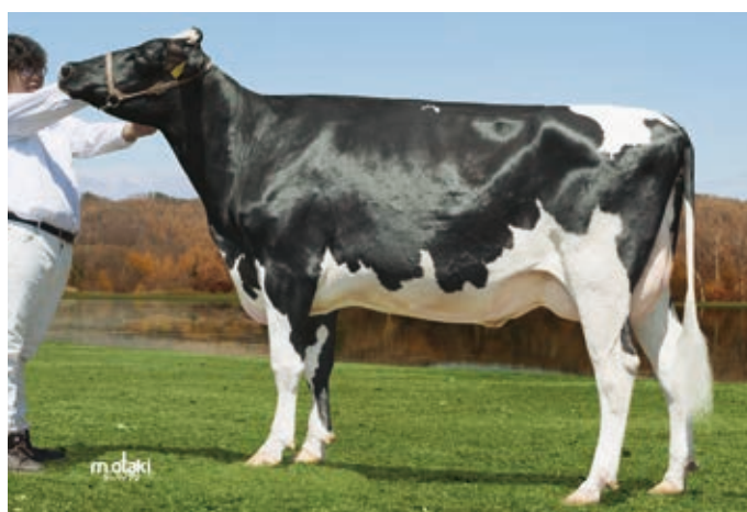
娘 フォレスト ミツキーランド プレジデント 北海道別海町 (株) フォレストファーム 所有 母の父: ストレチア ミラクル ジャステイス ET