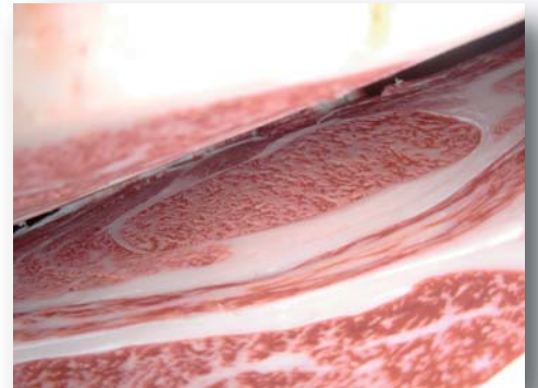
生産地：広島県 肥育地：島根県 性別：雌 母の父：茂重安福(岐阜) 母の母の父：平茂勝 枝重：502Kg ロース芯：69cm パラ厚：10.0cm BMS：9