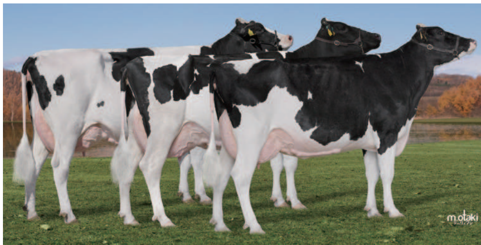
3頭立て(右手前)から